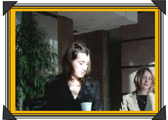
Deux employées de la Standard Life prennent des informations